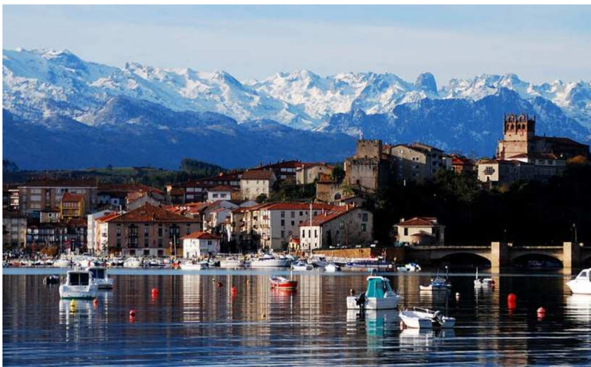
Foto de San Vicente de la Barquera

Después ya por otro de los Caminos a Santiago (flechas amarillas y el símbolo de una concha), el Camino Vadiniense, cruzaremos hacia León para visitar el nacimiento del emblemático río Sella y los territorios donde el oso pardo ha establecido su hogar.